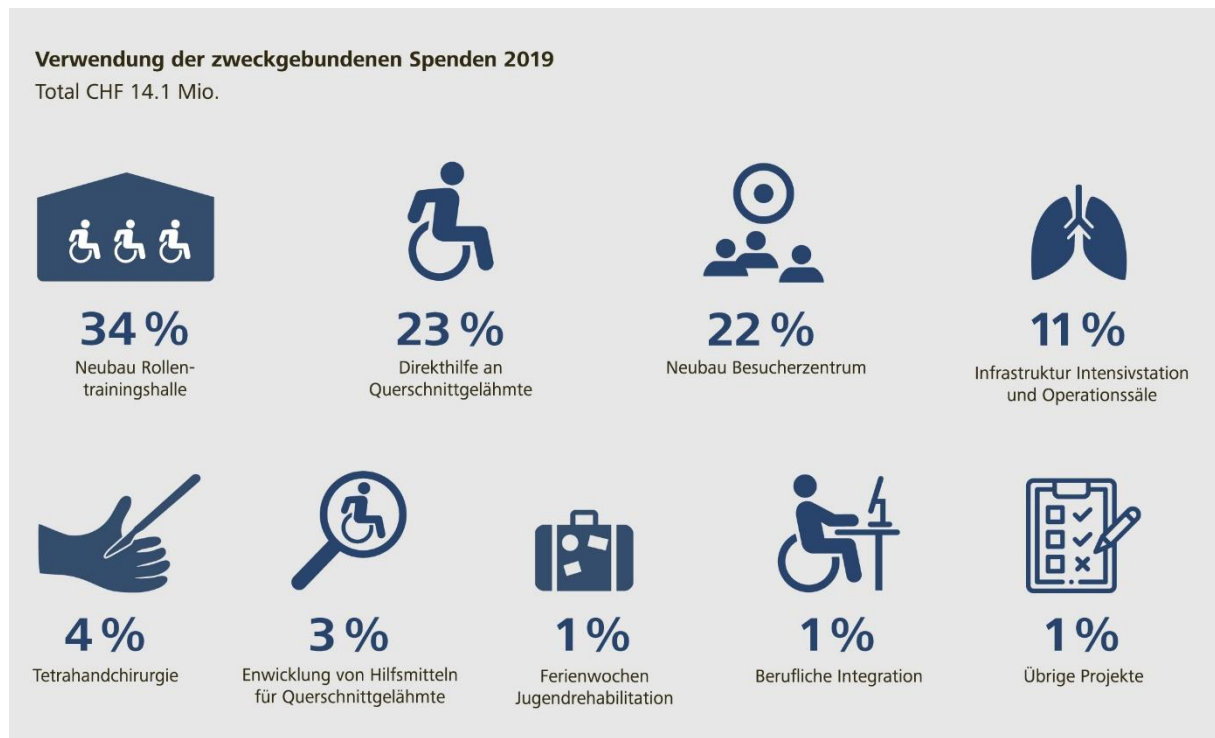
Verwendung der zweckgebundenen Spenden im Jahr 2019