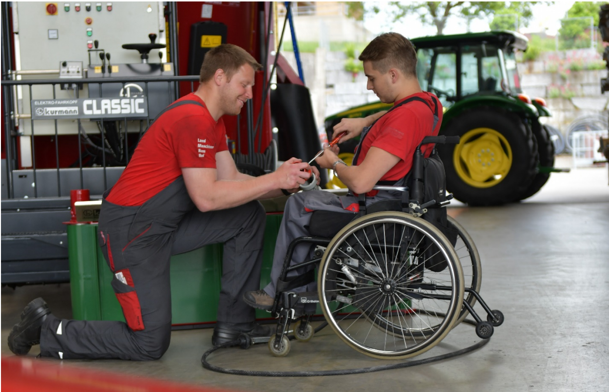
Weltrekord: Über 60 Prozent aller Menschen mit Querschnittlähmung in der Schweiz werden in die Arbeitswelt integriert.