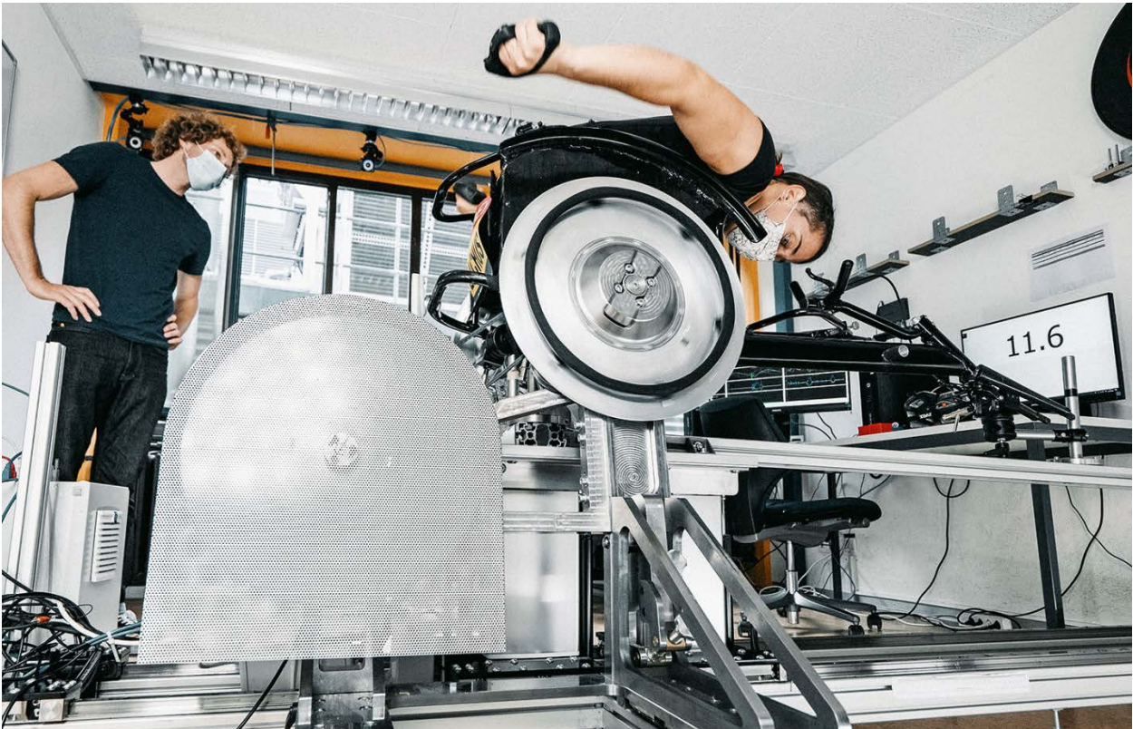
Hier wird die optimale Sitzposition zur Entlastung der Schultern getestet.